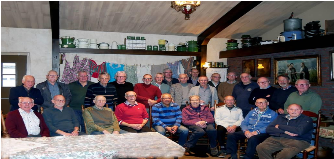
26 Vrijwilligers van de SWU tijdens de Vrijwilligersbedankdag 2024 / foto Henk Lunenburg (*)