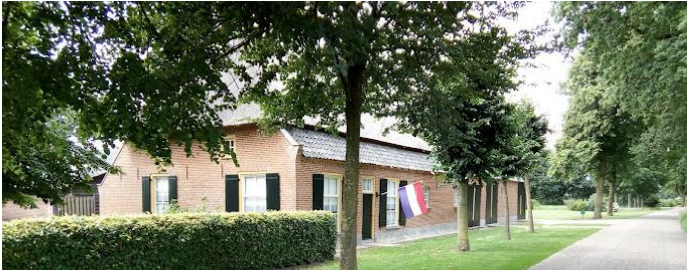
De langgevelboerderij van het Plattelandsmuseum Duinhove (1865) aan de Dorshout 1 te Uden, foto Ton..

Tegen 13.00 uur genoten we van een goedverzorgde Brabantse koffietafel. Henk van Lunenburg maakte een groepsfoto van de vrijwilligers en vanaf 15.00 uur tafelden zo'n 15 vrijwilligers nog even na tot 16.00 uur. We keerden voldaan en tevreden huiswaarts. Iedereen was goed te spreken over dit door Rinus van Helvoirt aangedragen idee.