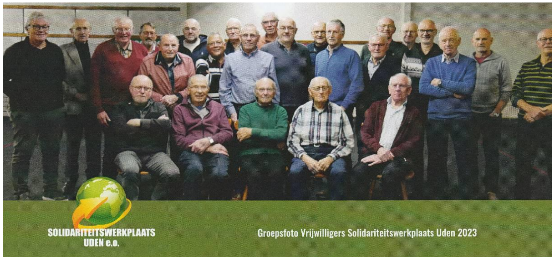
25 Vrijwilligers van de SWU tijdens de Vrijwilligersbedankdag 2023

Het werk in en voor de werkplaats SWU werd verricht door 32 uitvoerende vrijwilligers en 5 bestuursleden. We zitten allen in de derde levensfase (de herfst) van ons leven en maken deel uit van 2.4 miljoen ouderen tussen de 60 en 80 jaar. Sommigen zitten al in de vierde levensfase (de winter). In Nederland zijn dat 850.000 inwoners tussen de 80 en 100 jaar.