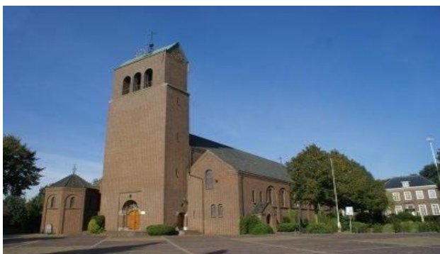
Kerk geloofsgemeenschap Geffen