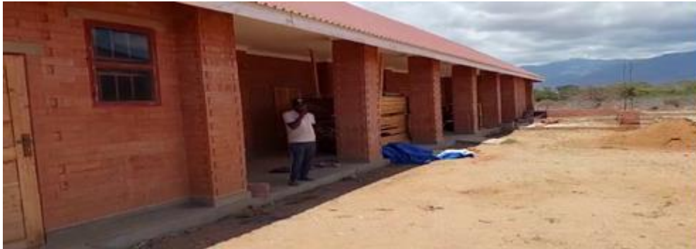
De slaapzalen, de keuken en de gemeenschappelijke ruimte VTC Mabilioni TZ