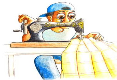
@ Illustratie Gert de Goede Uden / copyright

Regelmatig wordt een oproep gedaan via de media, waarin onze werkplaats, de inwoners in de gemeente Uden en haar omgeving vraagt om de in onbruik geraakte spullen bij ons te komen inleveren. Ook worden met hulp van kerkelijke instellingen frequent "bergen" gereedschap ingezameld.