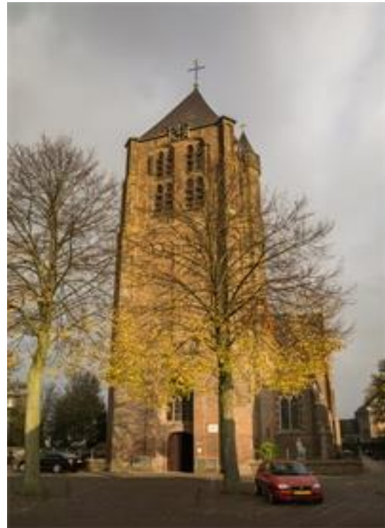
Parochie de Goede Herder Heesch

De inspanningen en de reacties vanuit de kerkdorpen waren lovend.