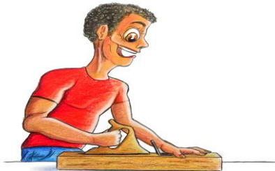
@ Illustratie Gert de Goede Uden / copyright

Onze maatschappelijk verantwoorde manier van werken komt op verschillende manieren tot uiting. Namelijk hoe wij solidair met mensen omgaan (people), de manier waarop we met onze omgeving, grondstoffen en andere middelen omgaan (planet) en tenslotte de manier waarop wij de winst en de doelstellingen definiëren (profit).