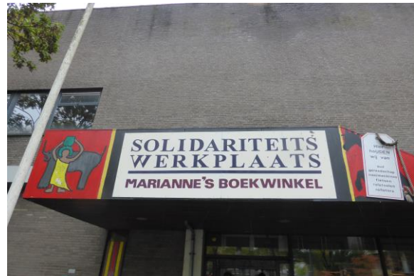
Mariannes boekenwinkel

We ontvingen kort na het verlaten van het pand een stevige financiële handdruk van haar.