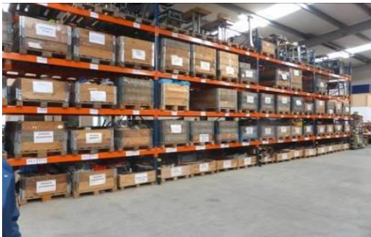
Het centrale magazijn VAI in Alphen

VAI draagt zorg voor het uitzetten van de opdrachten bij de aangesloten werkplaatsen en verzorgt het transport van de goederen naar de 3 e wereld. Met financiële steun van tal van sponsors wordt de productie en het transport betaald. Per jaar gaan 4 volle zeecontainers naar Afrika. In de werkplaatsen worden naast projecten voor VAI ook gewerkt aan aanvragen door andere organisaties.