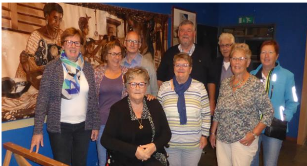
De parochieleden St. Franciscus Veghel

Ondertussen werd het gezelschap in de gelegenheid gesteld om de berg ingezameld gereedschap te bewonderen.