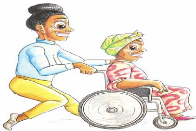
@ Illustratie Gert de Goede Uden / Copyright

De keuze voor deze naam dateert van 1996 en zou aan nodig onderhoud onderhevig zijn. "Solidair zijn" betekent, dat je door een gevoel van saamhorigheid verbonden bent met een ander die in vele opzichten te kort komt en daaraan consequenties verbindt. Die betekenis heeft in die 22 jaar absoluut niet aan betekenis en waarde verloren.