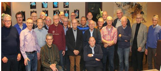
Vrijwilligers tijdens VW-bedankdag 12-2018