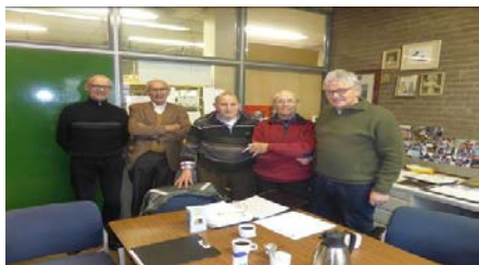
Het bestuur van de SWU