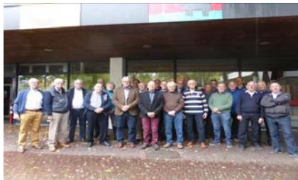
24 van de 30 vrijwilligers (2016).

Uit de vrijwilligers hebben we 5 personen bereid gevonden om het bestuur van de stichting Soli-dariteitswerkplaats Uden e.o. te helpen vormen.