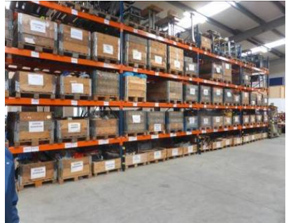
Het centrale magazijn van VAI.

Toen we bijna 2 jaar verstoken bleven van betaalde opdrachten van ons moederbedrijf Vraag en Aanbod Internationaal Alphen, hielden we ons hoofd boven water door gebruik te maken van onze oplossingsgerichte eigenschappen. We hebben veel projecten van partners in ons eigen netwerk helpen uitvoeren. Het viel niet altijd mee, maar ontwikkelingswerk mag gerust wat moeite kosten.