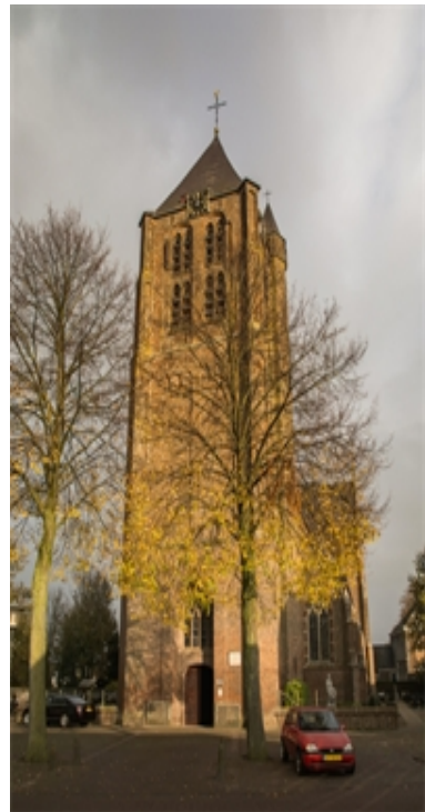
Parochie de Goede Herder Heesch.

We deden deze kerkelijke inzamelactie in voorgaande jaren met succes en zullen deze in de komende jaren blijven herhalen.