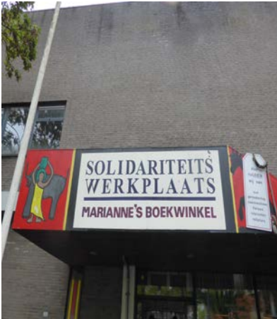
Het uithangbord aan de voorkant van het oud PTT-kantoor.