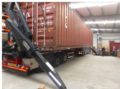
Bij VAI wordt een container afgeleverd voor projecten in Kenya.

Voor 2017 werden vanuit het Logistiek Centrum van VAI in Alphen 4 containers met daarin de goederen voor 80 projecten aangeleverd. Voor de realisatie van het transport en levering werd door VAI voldoende werkkapitaal bijeengebracht.